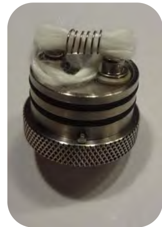
Bild 6: Die Ortmann-Schnur nun bündig mit der Außenkante vom Sockelboden abschneiden und gut mit Liquid befeuchten. Um evntl. überschüssiges Liquid vom Sockelboden aufzunehmen, empfehlen wir einen Strang der Schnur als Docht auf den Sockelboden zu legen.

Die genannten Materialien und Drahtstärken dienen nur als Beispiel, andere Heizdrähte, abweichende Anzahl der Windungen sowie größere/kleinere Durchmesser sind ebenfalls möglich.