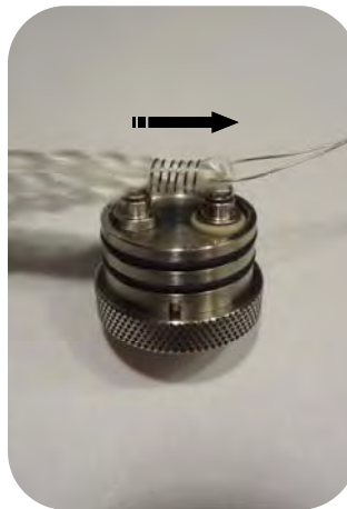
Bild 5: Mit Hilfe einer Drahtschlinge eine doppelt gelegte Ortmann-Schnur durch die Wicklung ziehen.