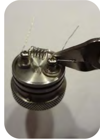
Bild 3: Mit Hilfe eines Seitenschneiders oder einem anderen geeigneten Werkzeug die überstehenden Drahtenden bündig mit den Schraubenköpfen abschneiden.