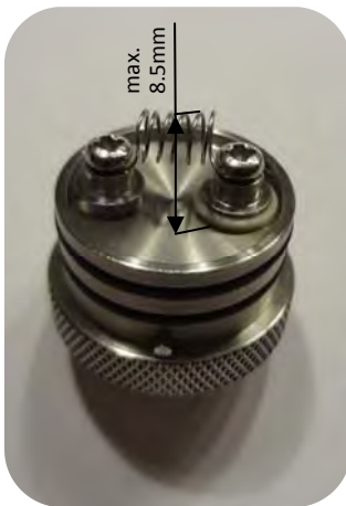
Bild 4: Hinweis: Der Abstand zwischen Oberkante Wicklung und dem Sockelboden darf 8.5mm nicht überschreiten, da diese sonst mit dem Kammerboden in Berührung kommt, was einen Kurzschluss zur Folge haben kann.