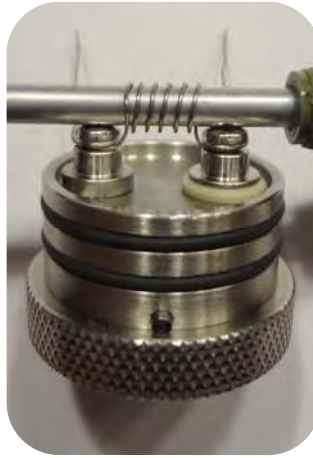
Bild 2: Den Draht, wie dargestellt, unter die beiden Polschrauben legen. Diese anschließend vorsichtig festziehen und die Wickelhilfe entfernen.