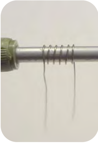
Bild 1: Über eine Wickelhilfe mit 2.5mm Durchmesser 6 Windungen mit 0.32mm Kanthal A Draht wickeln.